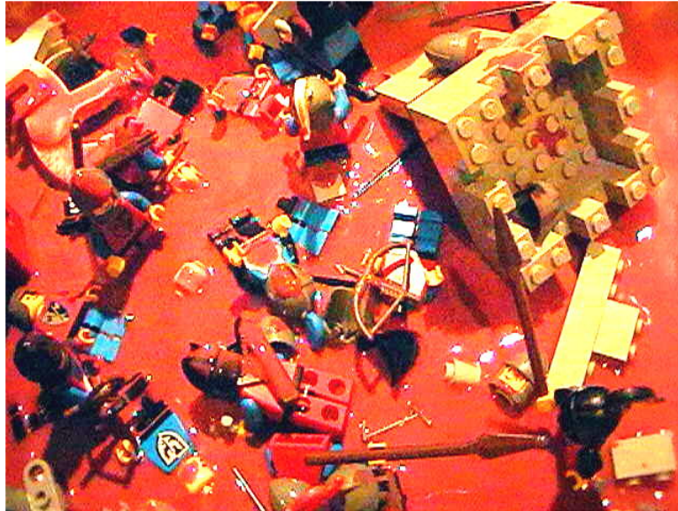
BlutbadTotale.jpg (84KB, image/jpeg )