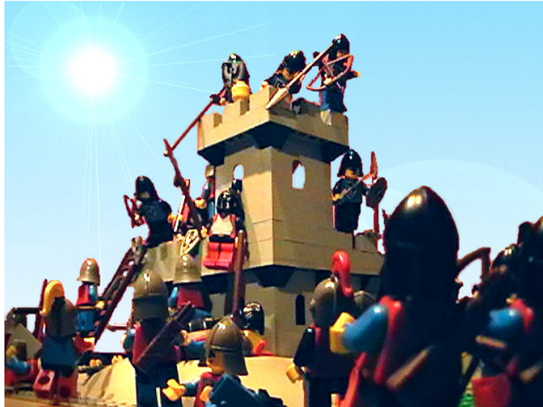
Belagerungtotal.jpg (58KB, image/jpeg )