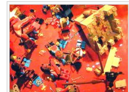
"Sie töteten jeden in der Stadt"