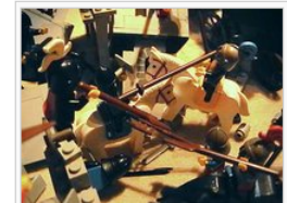
"Die Unsrigen verfolgten sie und töteten viele"