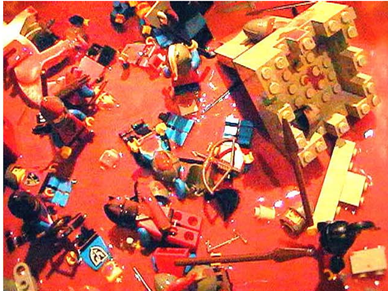
BlutbadTotale.jpg (84KB, image/jpeg )