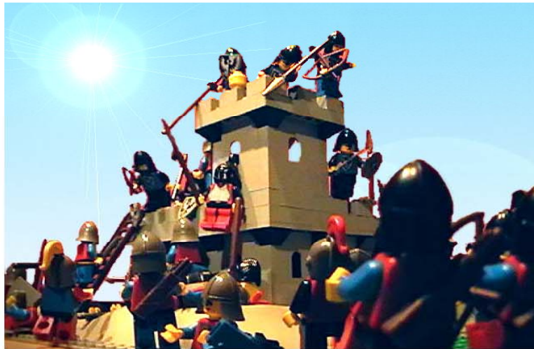
Belagerungtotal.jpg (58KB, image/jpeg)