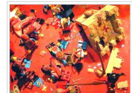
"Sie töteten jeden in der Stadt"